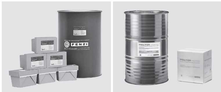
㊦ 2次シール材「ホットバー」 ㊦ 乾燥剤「モルバー」

モシール社を買収。フェンジーグループのスペーサー製品のポートフォリオにサーモシール社の「サーモフレックス」「サーモバー」を加えることで、複層ガラス資材の総合的なサププライヤーを目指す。